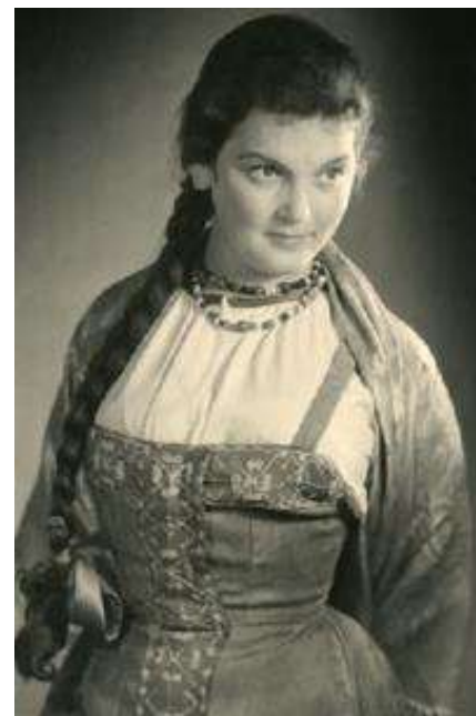
Варвара. Пьеса «Гроза»