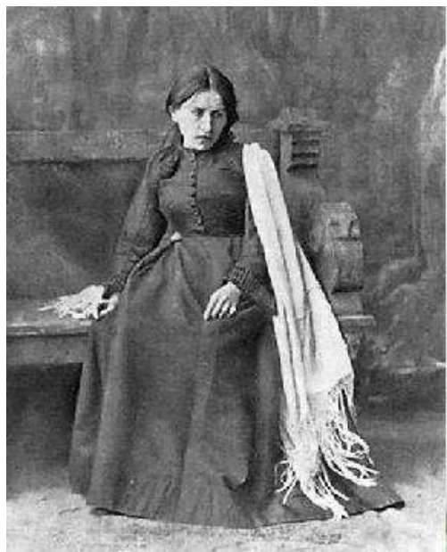
Катерина. Пьеса «Гроза»

Наиболее ярко женскую жизнь иллюстрируют три персонажа Островского: