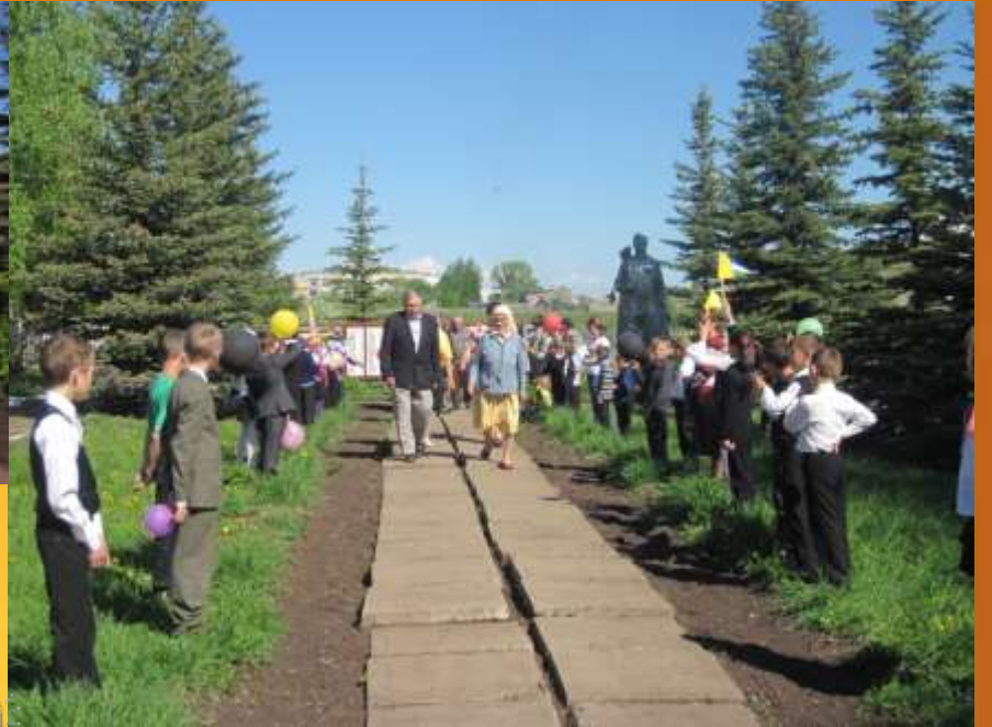
Фото на память. Труженики тыла и дети войны.