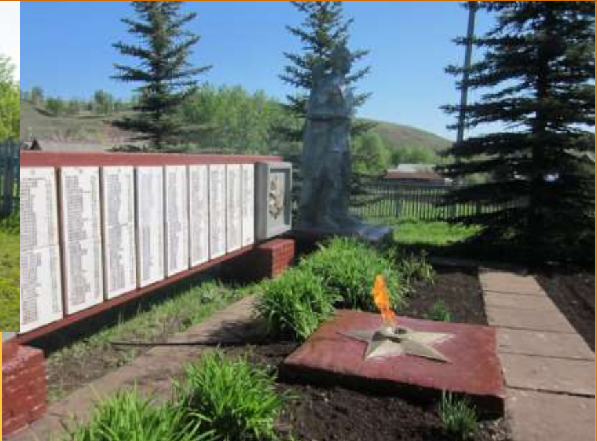
Возложение венка у вечного огня